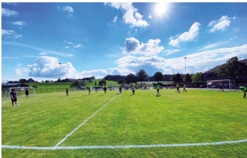
Schulfest 2023/24: SchülerInnen-LehrerInnen Match